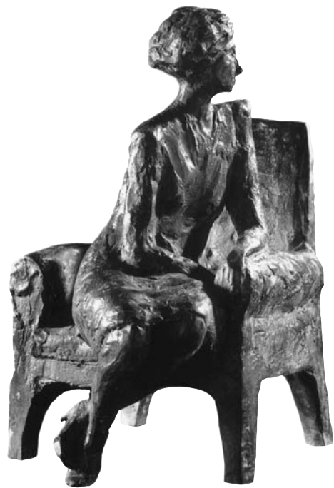
Escultura de Ernesto Barreda.